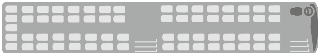
Variante 1 S 419 UL - 65 sièges