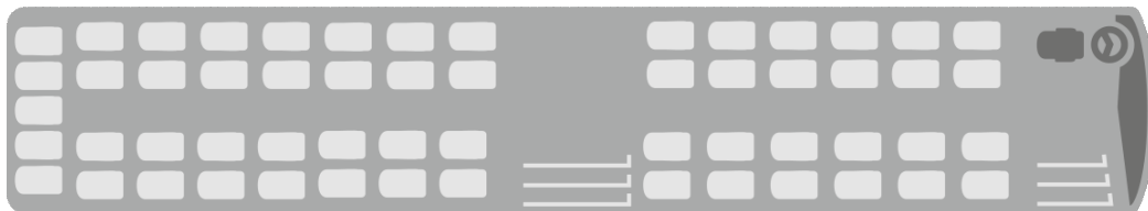
Variante 1 S 417 UL - 57 sièges + WC